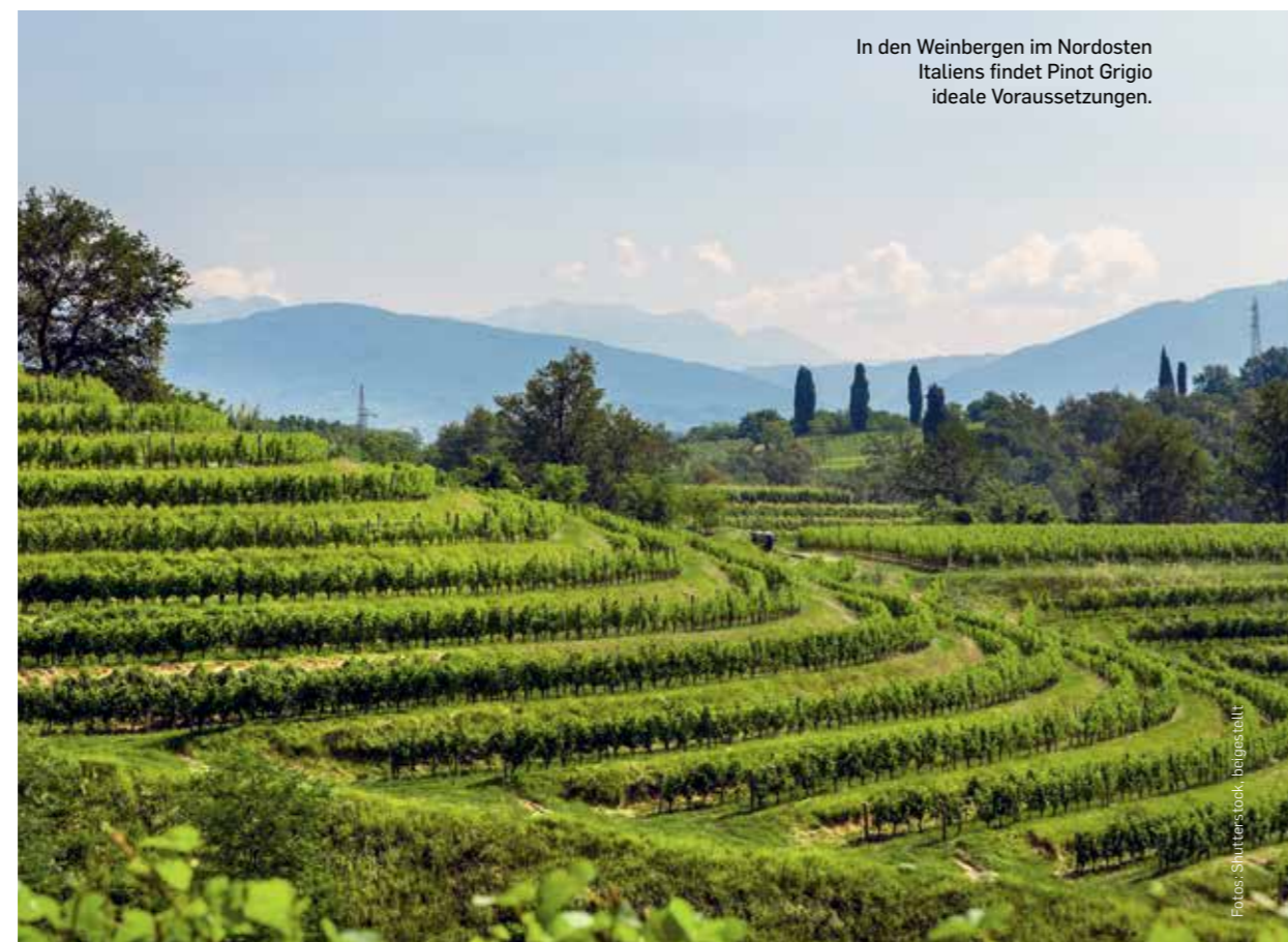
In den Weinbergen im Nordosten Italiens findet Pinot Grigio ideale Voraussetzungen.

13,5 Vol.-%, DIAM. Intensives, satt leuch-